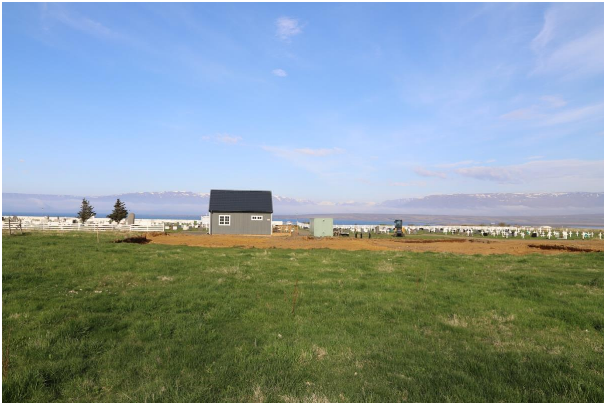
Kirkjugarðurinn á Sauðárkróki

Svarfaðardal : endurnýjun girðingar. Kirkjugarðar Akureyrar : endurnýjun lýsingar. Munkaþverá : endurnýjun girðingar. Svalbarðsströnd : ný girðing, lagfæring sáluhliðs og bæta aðgengi. Kirkjugarðasamband Íslands : áframhaldandi vinna við gagnagrunninum gardur.is , útgáfa Bautasteins riti sambandsins og til að sjá um útreikninga vegna tekjuútteilingu til kirkjugarðanna, en útteilingin byggir á gjaldalíkani er Kirkjugarðasamband Ísland lét vinna. Auk þessa var á árinu unnið við lagfæringu og hirðingu á nokkrum niðurlögðum kirkjugörðum t.d. á Klyppsstað í Loðmundarfirði, Klausturhólum, Arnarbæli í Ölfusi, Skálmanesmúla, Selárdal, gamla garðinum Húsavík og Skálum á Langanesi.‘