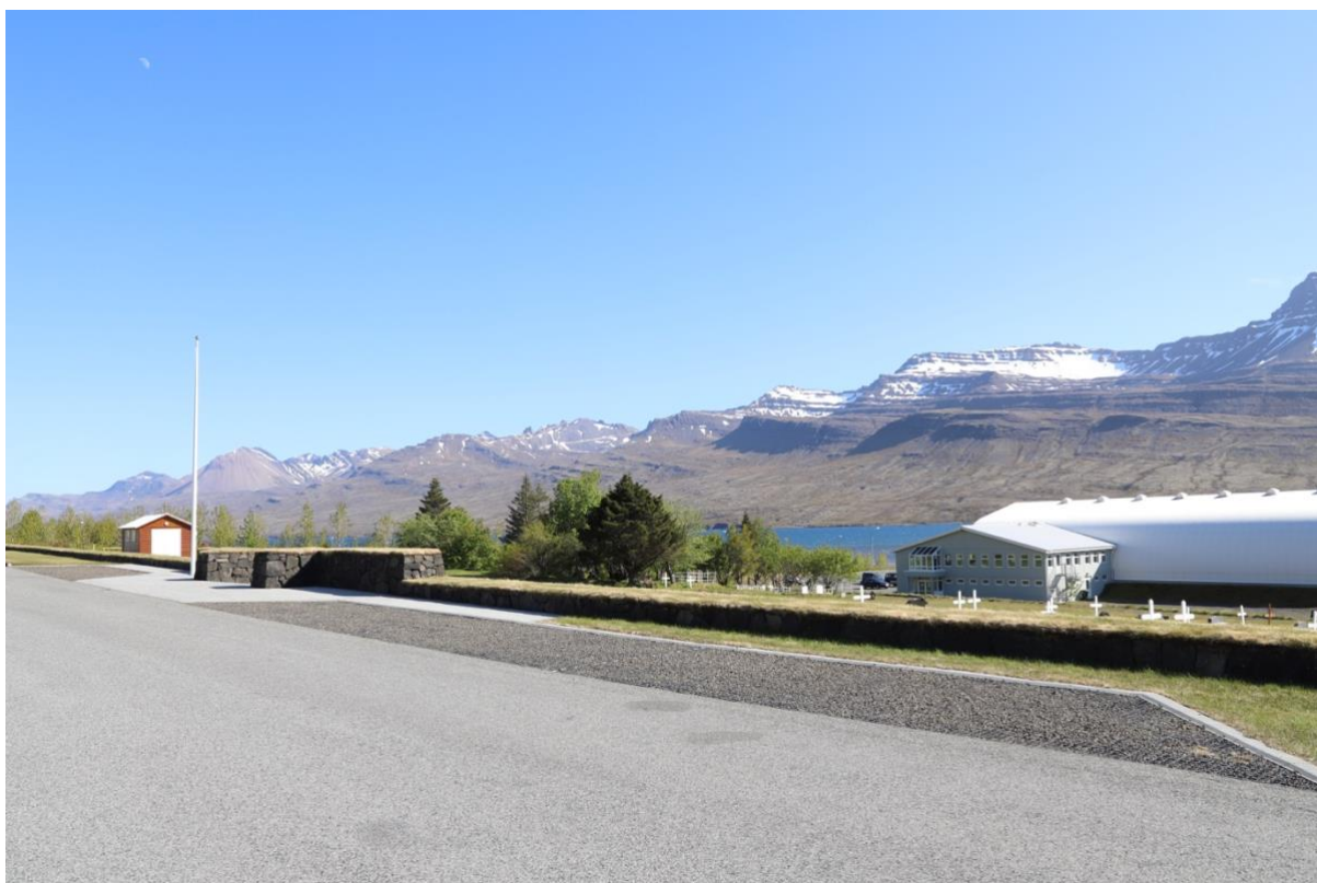
Kirkjugarðurinn á Fárskrúðsfirði